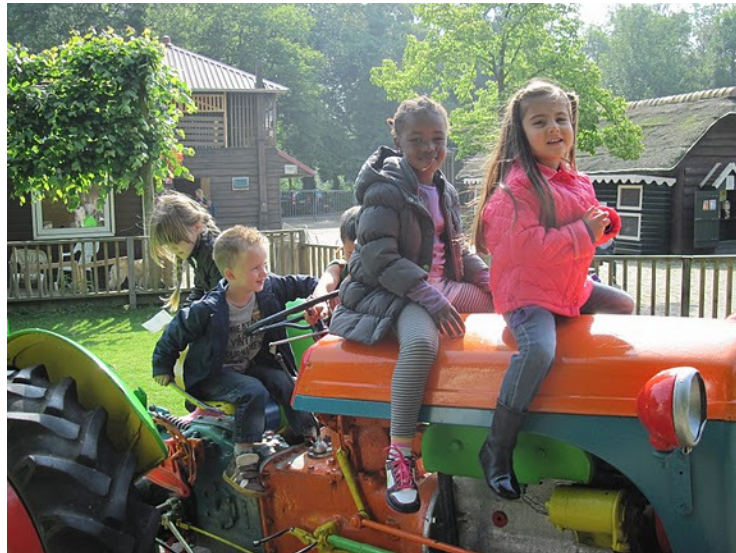
Naar de kinderboerderij

Kijk voor meer informatie op www.cjgrijnmond.nl of bel met de Opvoedlijn 010 – 20 10 110.