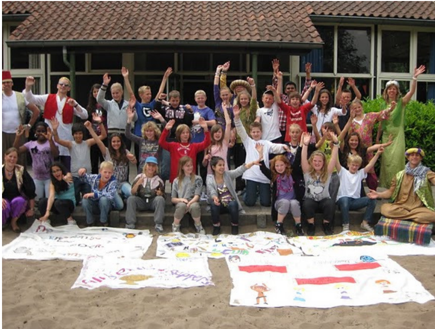
Groep 8 in Oosterhout