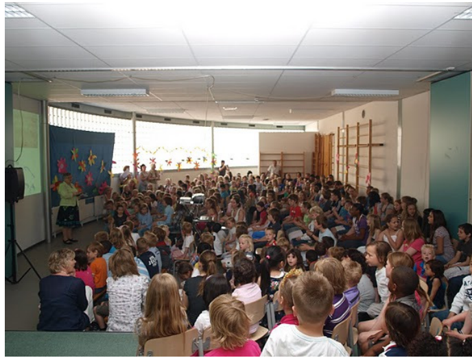
Paasviering in het speellokaal