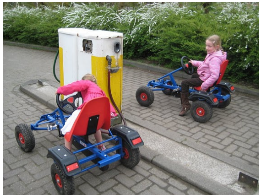
In de verkeerstuin in Plaswijck

De volledige klachtenregeling, waarin de procedure klachtbehandeling beschreven staat, ligt ter inzage bij de schoolleiding.