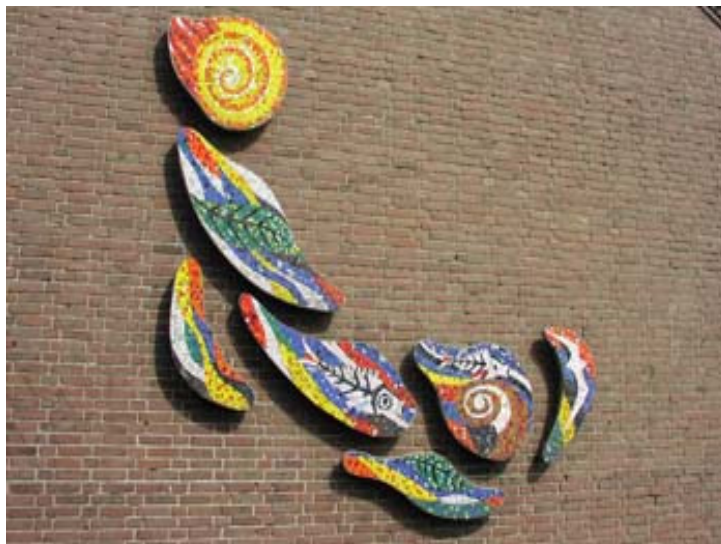
Groei van plant en dier