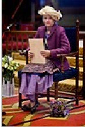
De Kinderkoningin van CBK op Kleine Prinsjesdag van 2010.